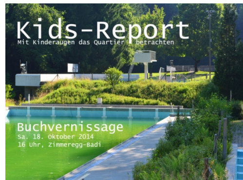
Portkarten für Buchvernissage