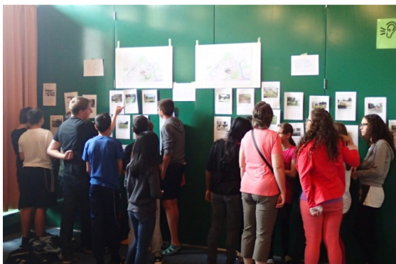
Vernissage zum Abschluss der Projektstage