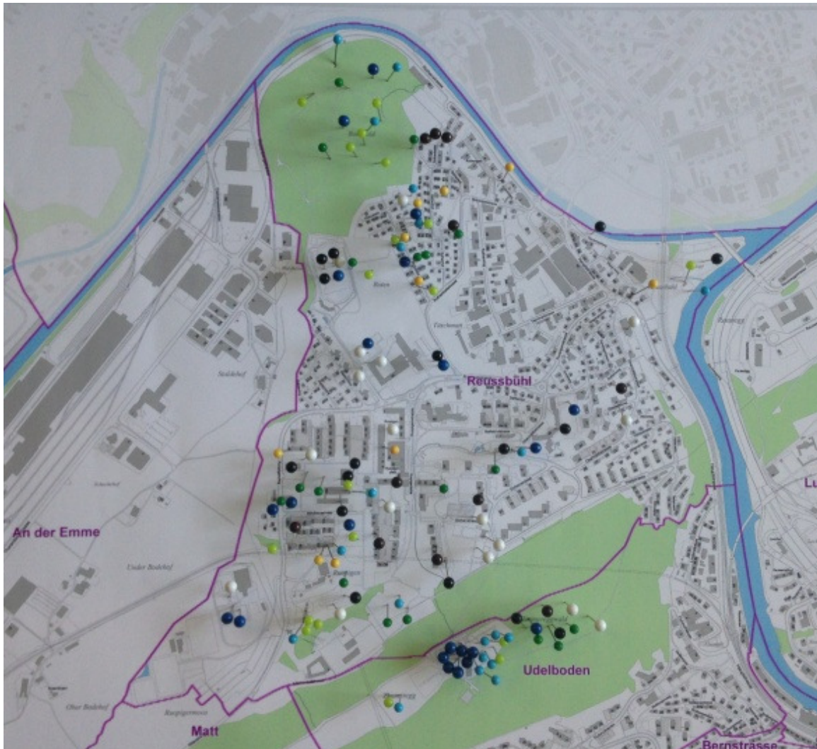
Quartierplan mit Stecknadelmethode