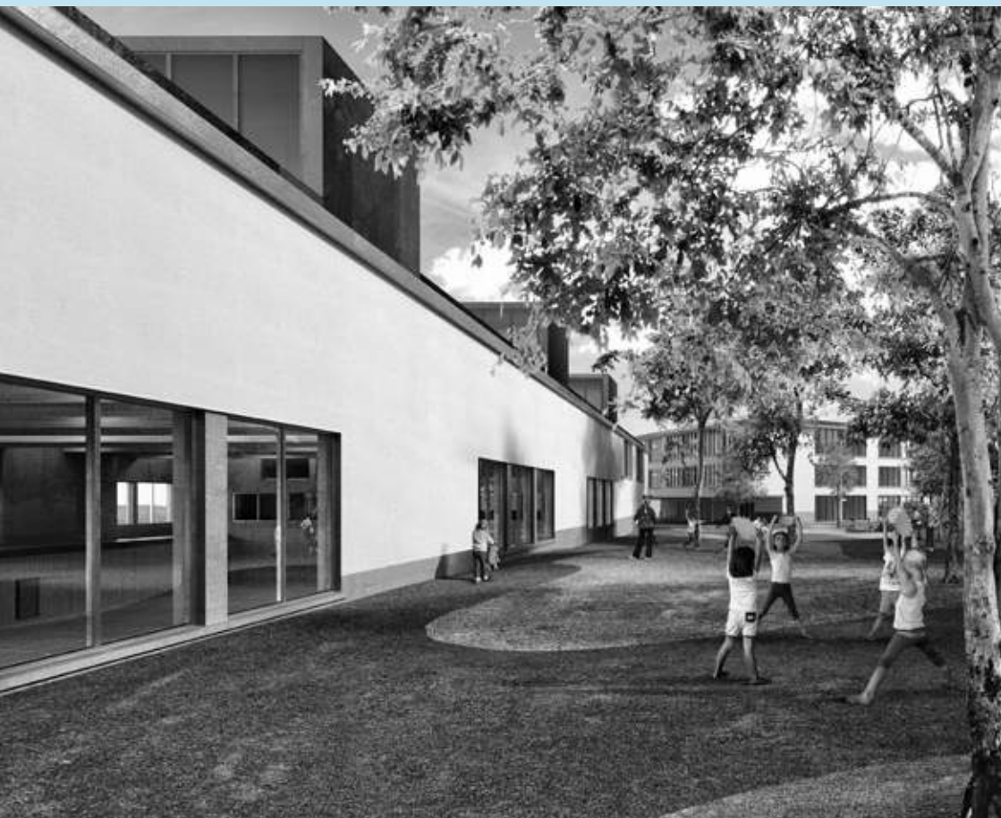
Die geplante Dreifachturnhalle (links) und das Kindergarten- und Betreuungsgebäude (im Hintergrund).