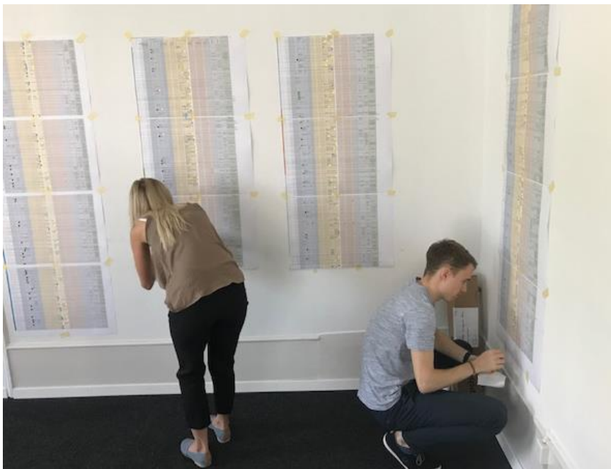
Abbildung 2 - Auswertung Befragung

Im Rahmen einer Kinder- und Jugendbefragung wurden rund 700 Kinder und Jugendliche aus der Stadt Luzern befragt. Ziel der Befragung war es, herauszufinden, welches die relevanten Themenbereiche der Kinder und Jugendlichen sind, die zu ihrer Lebensqualität in der Stadt Luzern beitragen. Die Zielgruppe der 0 – 18-Jährigen in der Stadt Luzern umfasst rund 12'000 Personen. Befragt wurden Kinder und Jugendliche aus 28 Schulklassen sämtlicher Stadtteile, Teilnehmer/innen von Workshops, Kinderparlamentarier/innen und Jugendparlamentarier/innen, Eltern von Kindern im Vorschulalter, sowie weitere Jugendliche, die nicht über die genannten Formate erreicht werden konnten. Total gingen (ohne Workshops) 635 Antworten ein. Details finden sich im Bericht der Kinder- und Jugendbefragung vom August 2018.