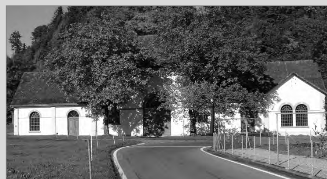
1320 wurde erstmals die Mühle Thorenberg erwähnt. Später entstanden hier die Hammerschmiede, Baumwollspinnerei, Kunstmühle und 1886 das Elektrizitätswerk.