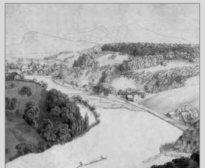
Seit 1305 zwingt sich der Verkehr entlang der Krummfluh.