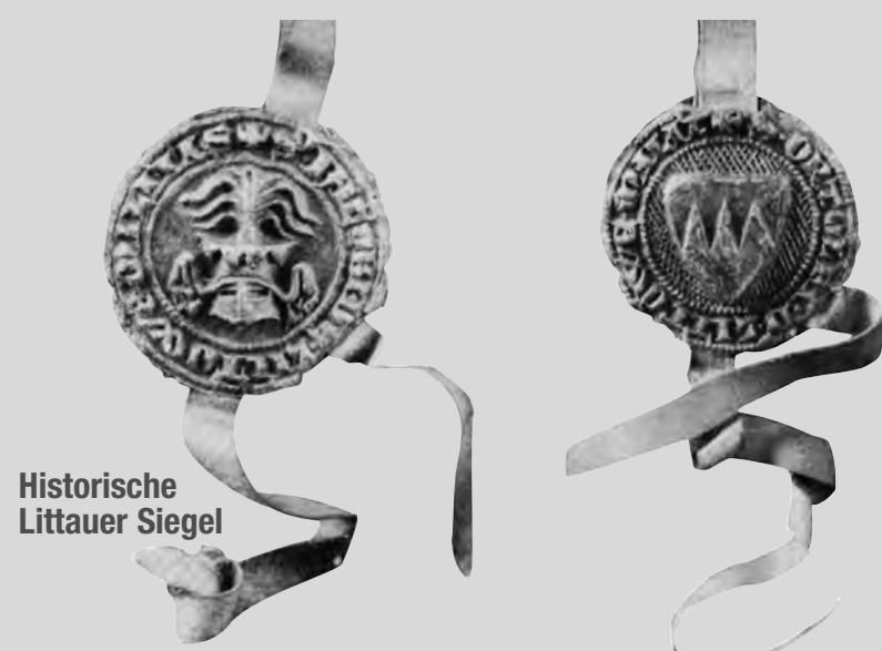
Historische Littauer Siegel