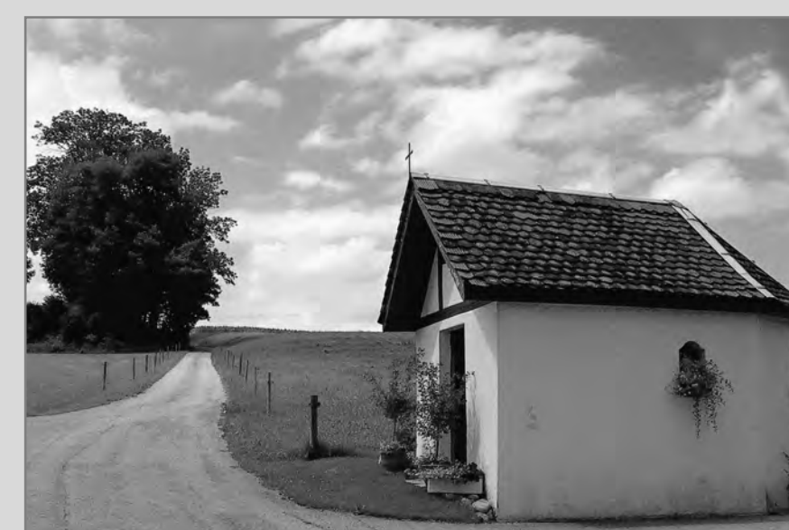
Kapelle Schwand an der alten Heerstrasse.