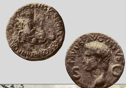
Römische Münze, Ø 27 mm, gefunden 1889 bei Thorenberg. Augustusmünze, geprägt unter Caligula.