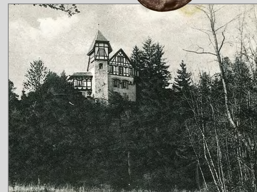
Die Burg Tornberg (Thorenberg) wird erstmals 1363 erwähnt als Lehen des Klosters im Hof Luzern.