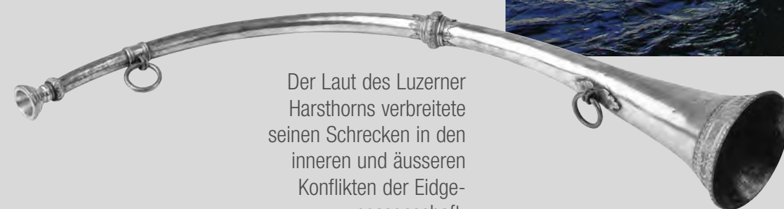
Der Laut des Luzerner Harsthorns verbreitete seinen Schrecken in den inneren und äusseren Konflikten der Eidgenossenschaft.