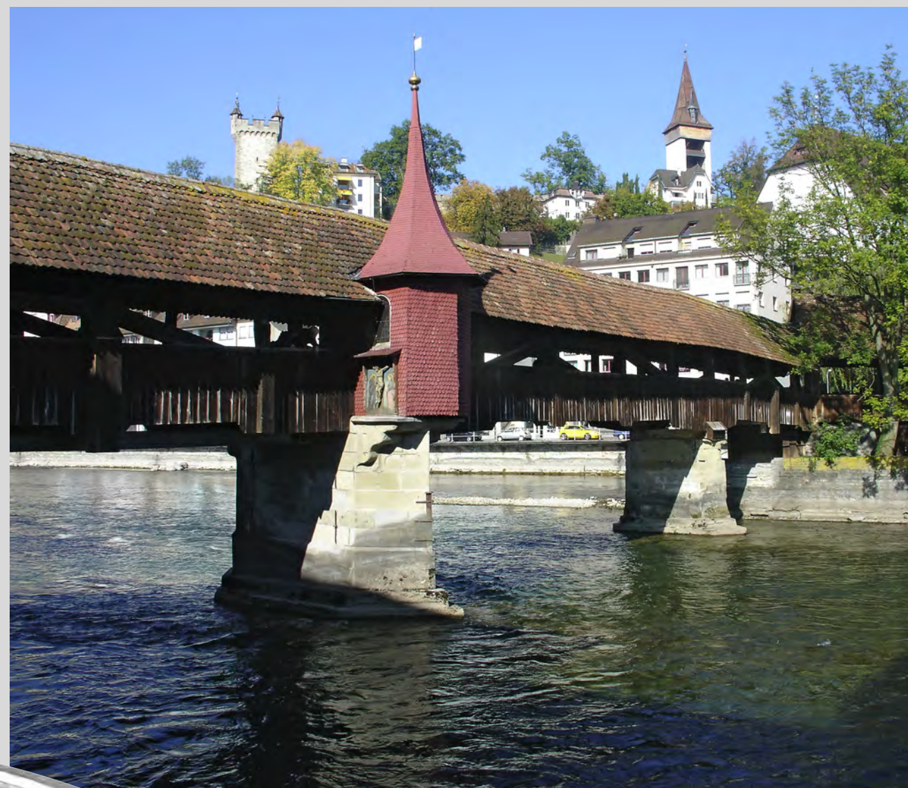
Als Teil der Stadtbefestigung wurde die Spreuerbrücke 1408 vollendet.