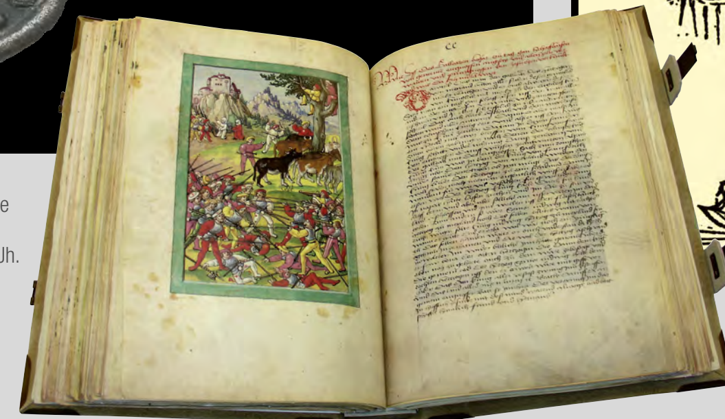
Selbstbewusster Rückblick und Standortbestimmung: Diebold Schillings Bilderchronik von 1513.

Vom aufkommenden Selbstverständnis als Stadtstaat zeugt das Luzerner Prunksiegel, in Gebrauch von 1386 bis 1712.