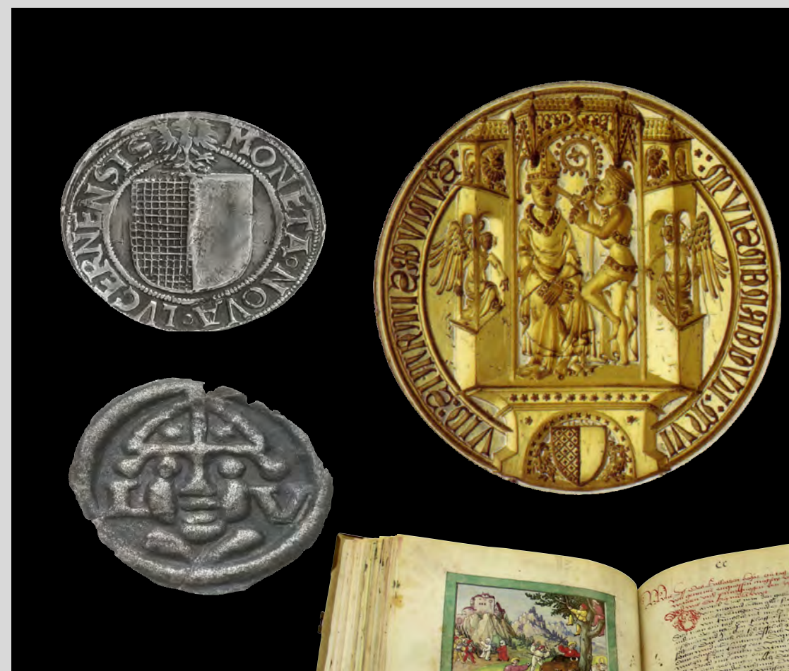
Ein Zeichen der Souveränität: 1420 konnte Luzern seine erste Münzstätte eröffnen. Luzerner Dicken aus dem 15. Jh. Das Stadtschild bekrönt mit einem Adler, «MONETA NOVA LVCERNENSIS», und Angster von Luzern, 15. Jh. Kopf des hl. Leodegar.