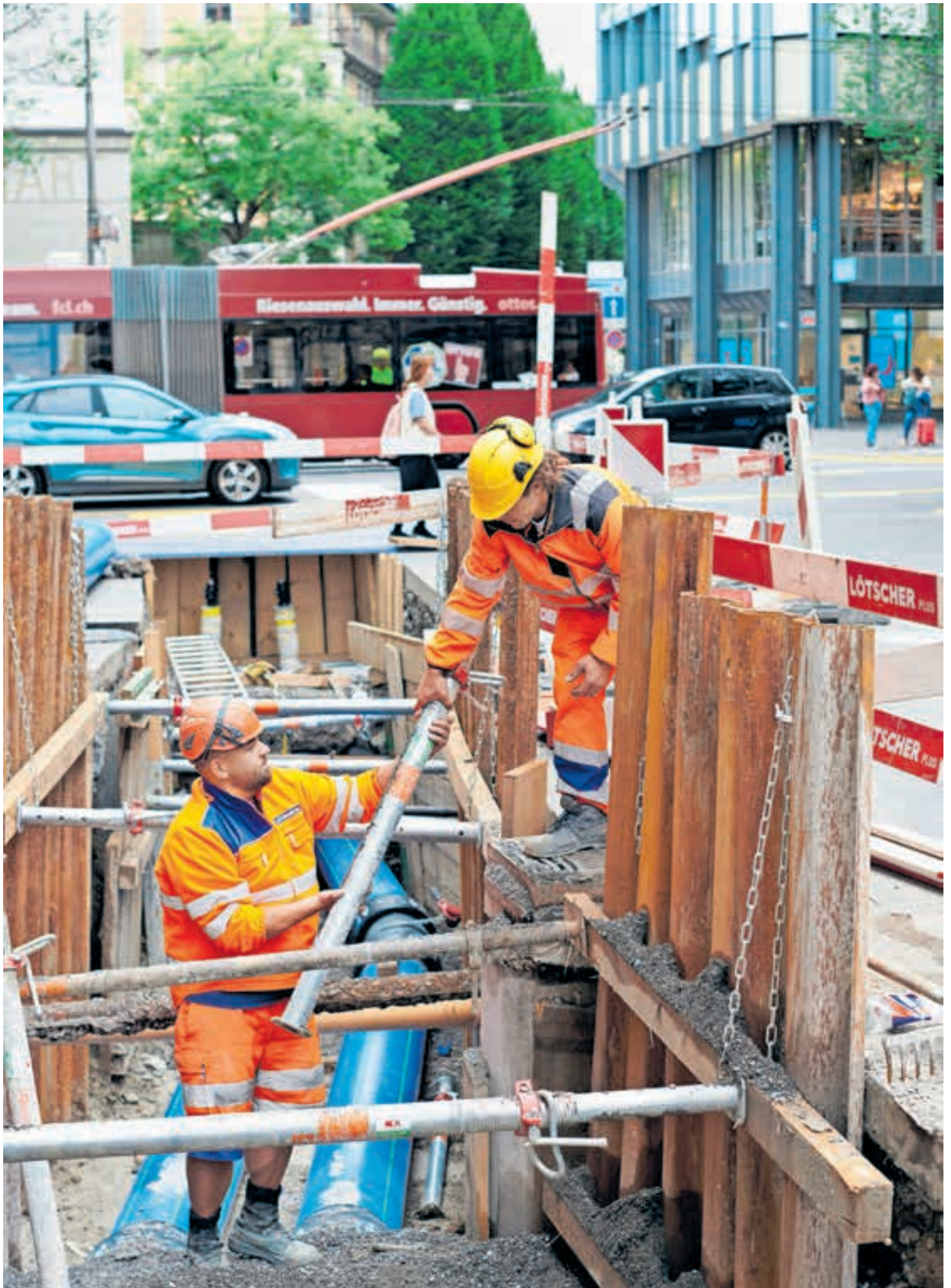
Bauarbeiten an der Morgartenstrasse für das See-Energie-Netz: Energie aus erneuerbaren Quellen soll gefördert werden. Das wollen die Klima- und Energiestrategie und der Gegenvorschlag dazu. Die Abstimmung findet am 25. September 2022 statt.