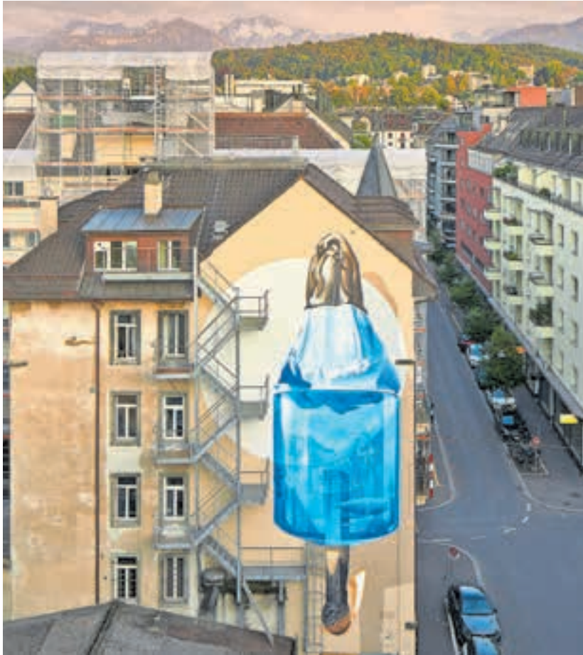
Der Klimawandel ist Realität: So hat die Anzahl der jährlichen Hitzetage in der Schweiz seit 1980 stetig zugenommen. Auch die Anzahl Tage mit starkem Niederschlag ist gestiegen.

Am 25. September 2022 wird über die Klima- und Energiestrategie und den Gegen-vorschlag dazu abgestimmt. Der Stadtrat empfiehlt, beiden Vorlagen zuzustimmen und bei der Stichfrage die Vorlage des Grossen Stadtrates zu wählen.