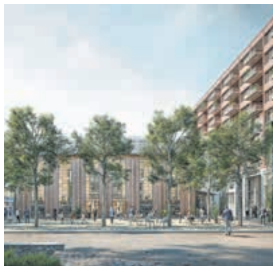
Visualisierung des Projekts der ewl Areal AG: Ziel ist es, nachhaltig zu bauen und attraktive Räume zu schaffen.