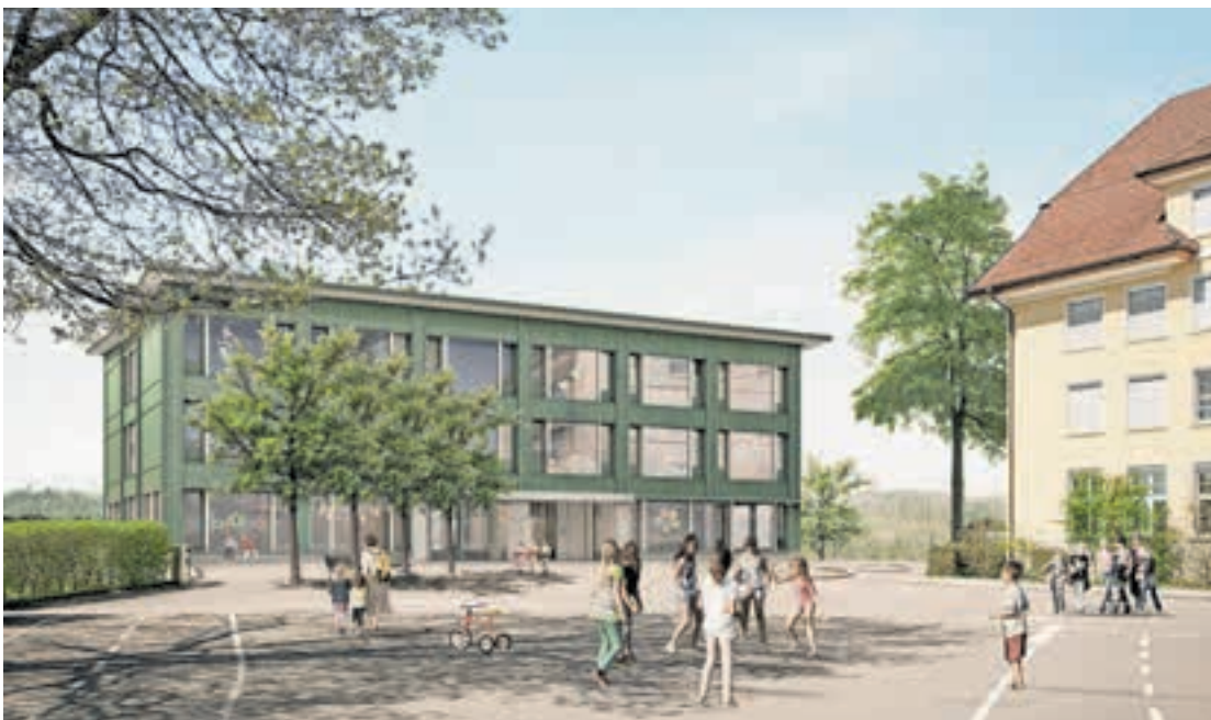
Um den Schulhof gruppieren sich die Schulhäuser: der Neubau Trakt C (links), das 1923 erbaute Hauptgebäude Trakt A (rechts) und, nicht auf der Visualisierung zu sehen, der Ergänzungsbau Trakt B.

Die Schule Littau Dorf ist seit 2014 eine sogenannte Sozialraumorientierte Schule (SORS-Schule). Nach diesem Prinzip ist die Schule als Begegnungszentrum und als Ausgangspunkt vieler Bildungs-, Betreuungs-, Freizeit- und Kulturangebote zu verstehen.