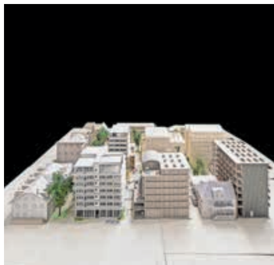
Das Karton-Modell zeigt die Anordnung der 14 Bauten des KIL-Projekts: vier bestehende und zehn neue Gebäude.