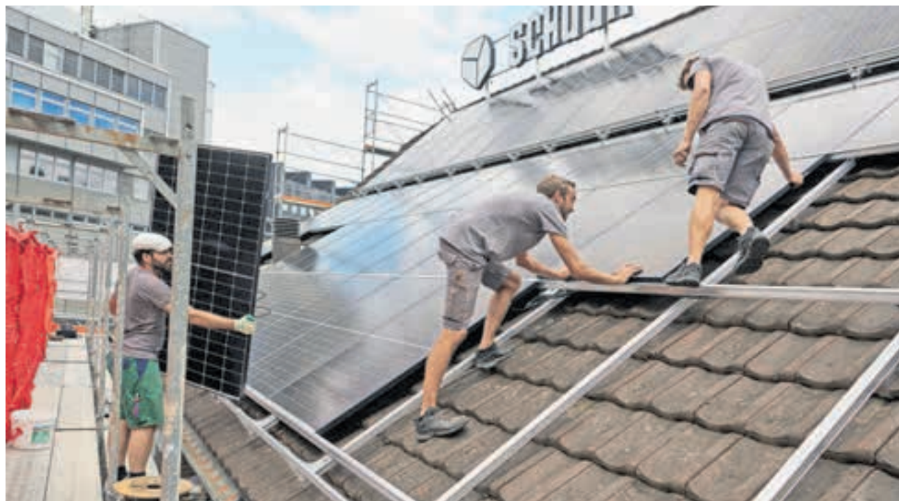
Eine Solaranlage für das Konzerthaus Schüür: Als Ersatz für Öl und Gas, und weil der Stromverbrauch für die Elektromobilität steigt, soll in der Stadt möglichst viel Solarstrom produziert werden. Darin waren sich alle Fraktionen im Grossen Stadtrat einig.

Die Notwendigkeit der Klima- und Energiestrategie war im Grossen Stadtrat wenig bestritten. Auf grossmehrheitliche Zustimmung stiess auch das übergeordnete Ziel, die energiebedingten Treibhausgasemissionen bis 2040 auf null zu reduzieren.