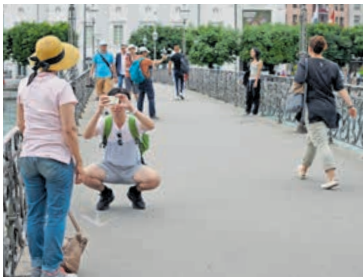
Beliebt für Kurzaufenthalte: Das Angebot an Business- und Ferienwohnungen ist in der Stadt Luzern in den letzten Jahren deutlich gewachsen.

Der Stadtrat legt zur Initiative «Wohnraum schützen – Airbnb regulieren» einen Gegenvorschlag vor. Er enthält ein Reglement über Zweitwohnungen zur Kurzzeitvermietung. Damit soll ein ausgewogenes Mass an Business- und Ferienwohnungen ermöglicht werden.