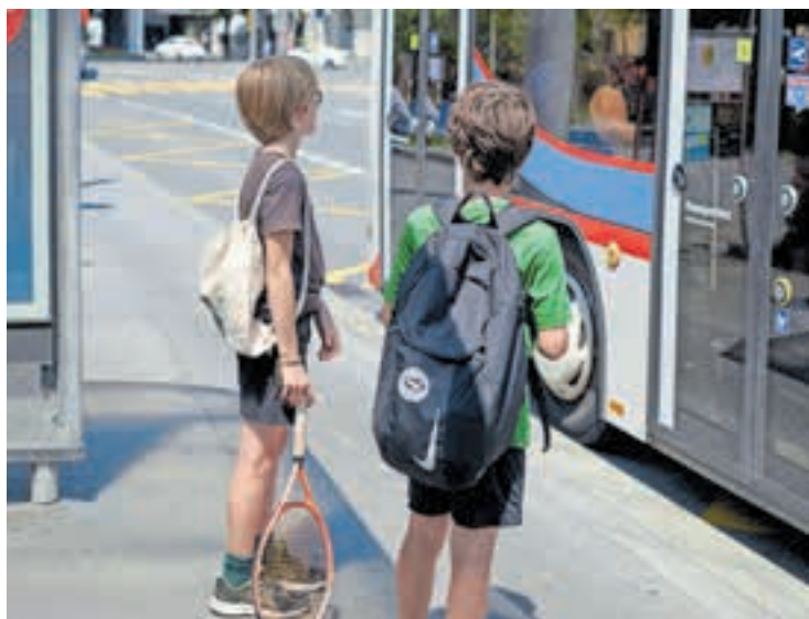
Der Preis für den öffentlichen Verkehr soll kein Grund sein, um auf Freizeitaktivitäten zu verzichten.

Kinder und Jugendliche zwischen 6 und 16 Jahren sollen ab Sommer 2023 Gutscheine im Wert von 300 Franken für den Bezug von Bus- und Bahnbilketten erhalten. Für einen dreijährigen Pilotversuch beantragt der Stadtrat einen Sonderkredit von 4,995 Mio. Franken.