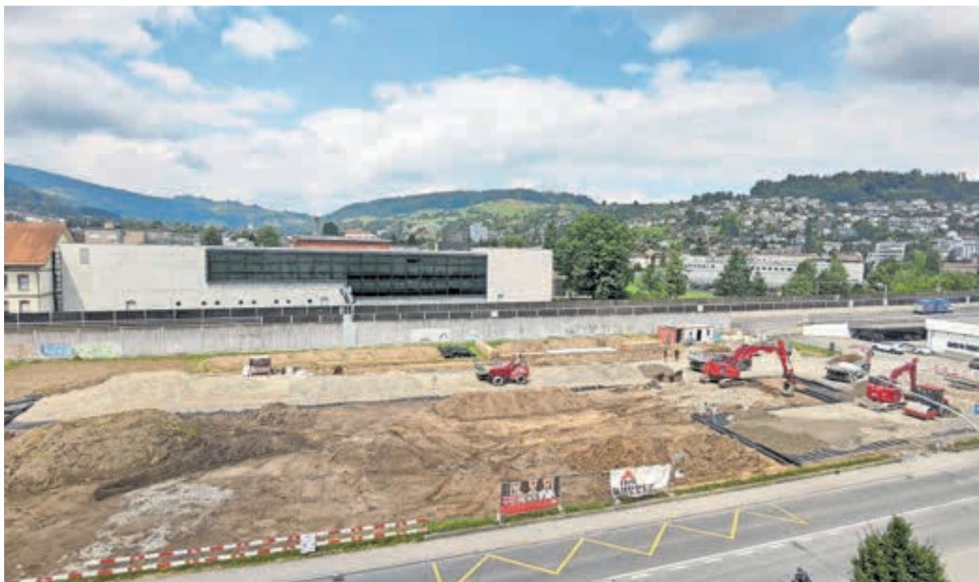
Voraussichtlich ab Ende Oktober 2022 werden auf dem Areal Rösslimatt in Kriens Reiseccars parkieren. Die 28 Parkplätze ersetzen jene, die beim Inseli aufgehoben werden.

Der Stadtrat hat den Strategieprozess Carregime abgeschlossen. Kurzfristig stehen dank des Carparkplatzes Rösslimatt genügend Parkplätze zur Verfügung. Für eine langfristige Lösung will der Stadtrat die Lösungsidee «Stadtpassage» prüfen.