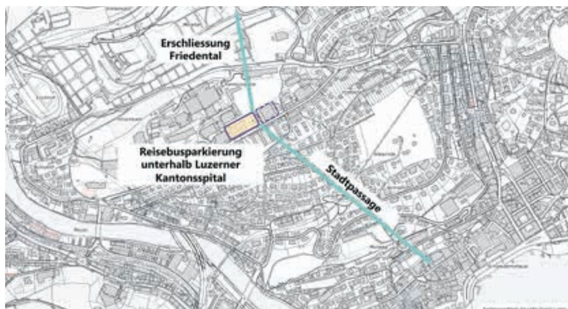
Die Lösungsidee «Stadtpassage»: Reisecars könnten künftig im Untergeschoss des geplanten Parkhauses des Luzerner Kantonsspitals parkieren. Die Gäste würden via Fussgängertunnel möglicherweise über Rollbänder in die Altstadt gelangen.

Gleichzeitig beantragt der Stadtrat beim Grossen Stadtrat auch die Zustimmung zur Änderung des Parkgebührenreglements für den Carparkplatz Rösslimatt in Kriens. Dies ermöglicht, ein Gebührensystem einzuführen, mit dem – wie vom Parlament gefordert – sowohl der Betrieb als auch die Investition für den Carparkplatz Rösslimatt Kriens finanziert werden können.