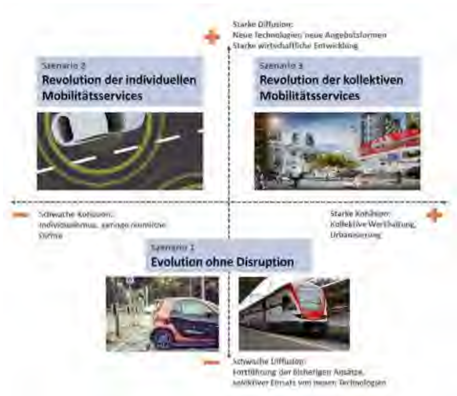
Abbildung 4: Szenarien im Forschungspaket «Verkehr der Zukunft 2060» des Bundes