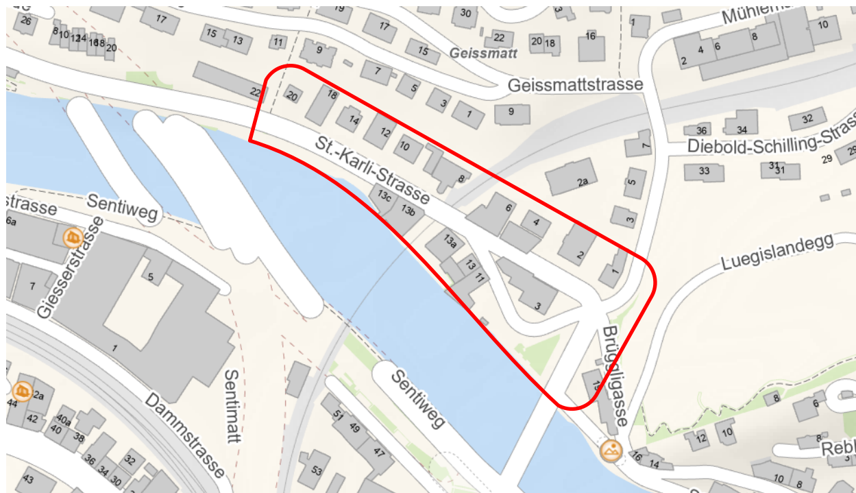
Bauperimeter mit verkehrlichen Einschränkungen ab November '24

Während den Bauarbeiten ab November 2024 wird der Verkehr in der St. Karli-Strasse im Bereich der Baustellen einspurig geführt (Bild Bauperimeter). Die Signalisation erfolgt mittels mobiler Lichtsignalanlagen. Im Bereich der Baustellen kann die Zufahrt zu den Parkplätzen und Liegenschaften unter Umständen nur temporär gewährleistet werden. Teilweise müssen Parkplätze temporär aufgehoben werden. Die Liegenseigenschaftseigentümer werden zeitnah von der Stadt Luzern über das weitere Vorgehen informiert.